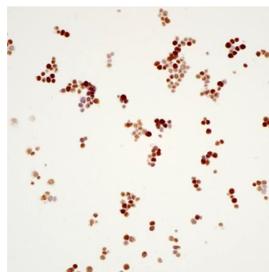
液态细胞质控品MUM1染色结果图